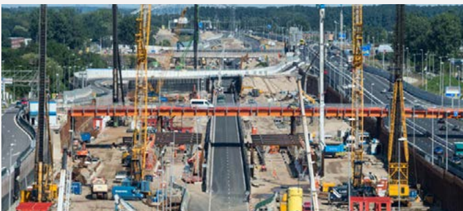
Gaasperdammertunnel in aanleg.

Snelweg A9, de Gaasperdammerweg, is een forse barrière en bron van lawaai en vuile lucht. Voor fietsers en voetgangers waren er tunneltjes onderdoor. Bij de verbreding, van 2x3 rijbanen naar 2x5+1 banen, werd de snelweg ingebouwd in een ' land tunnel '. Deze helpt om de leefbaarheid te verbeteren en lawaai en luchtvervuiling te beperken. De tunnel is 3km lang en heeft in het midden een opening bij de aansluiting met de Gooiseweg. Bovenop de tunnel wordt een park aangelegd. Misschien komen er ook woningen. Vanwege de werkzaamheden kan de route over de tunnel anders zijn dan op de kaart.